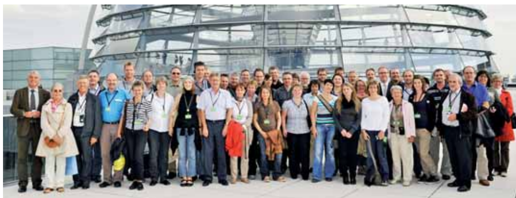
► Die Kolleginnen und Kollegen aus Württemberg vor der Reichstagskuppel.