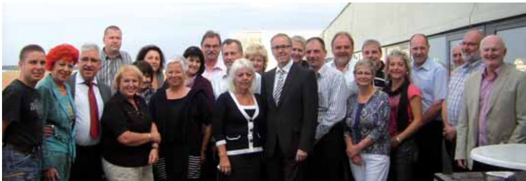
Die Mitglieder der DSTG-Tarifkommission kamen in der Zeit vom 21. bis 23. September 2011 in Neubrandenburg zu ihrer 83. Sitzung zusammen.

Einen Schwerpunkt der Sitzung bildete der Stand der Redaktionsverhandlungen über die Neufassung der Entgeltordnung zum Tarifvertrag für die Länder (TV-L), die am 1. Januar 2012 in Kraft treten soll. Im Vordergrund der ersten Stufe der neuen Entgeltordnung (EGO) steht hauptsächlich die „Entrümpelung“ (Bereinigung) der Tätigkeitsmerkmale der bisherigen Vergütungsordnung zum BAT, die bis