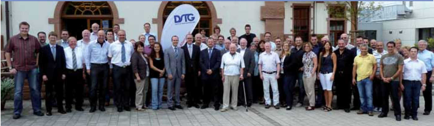
> Die Teilnehmer des DSTG-Landeshauptvorstandes Rheinland-Pfalz.

Bundvorsitzender Eigenthaler besucht Landeshauptvorstand in Kaiserslautern