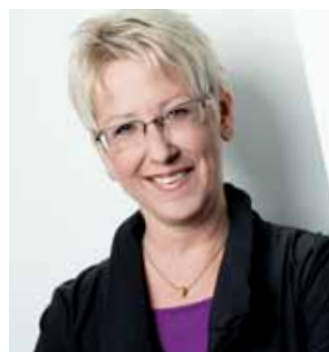
Die neue Vorsitzende des Bundestags-Finanzausschusses Dr. Birgit Reinemund, MdB.

In Nachfolge des FDP-Politikers Dr. Volker Wissing wurde Dr. Birgit Reinemund (FDP) zur neuen Vorsitzenden des Bundestags-Finanzausschusses gewählt. Aufgabe des aus 37 Mitgliedern bestehenden Bundestags-Finanzausschusses ist es, Gesetzentwürfe, Anträge, Berichte, Entschlüsse sowie Vorlagen der europäischen Union, insbesondere aus dem Bereich Steuerpolitik, federführend zu beraten und