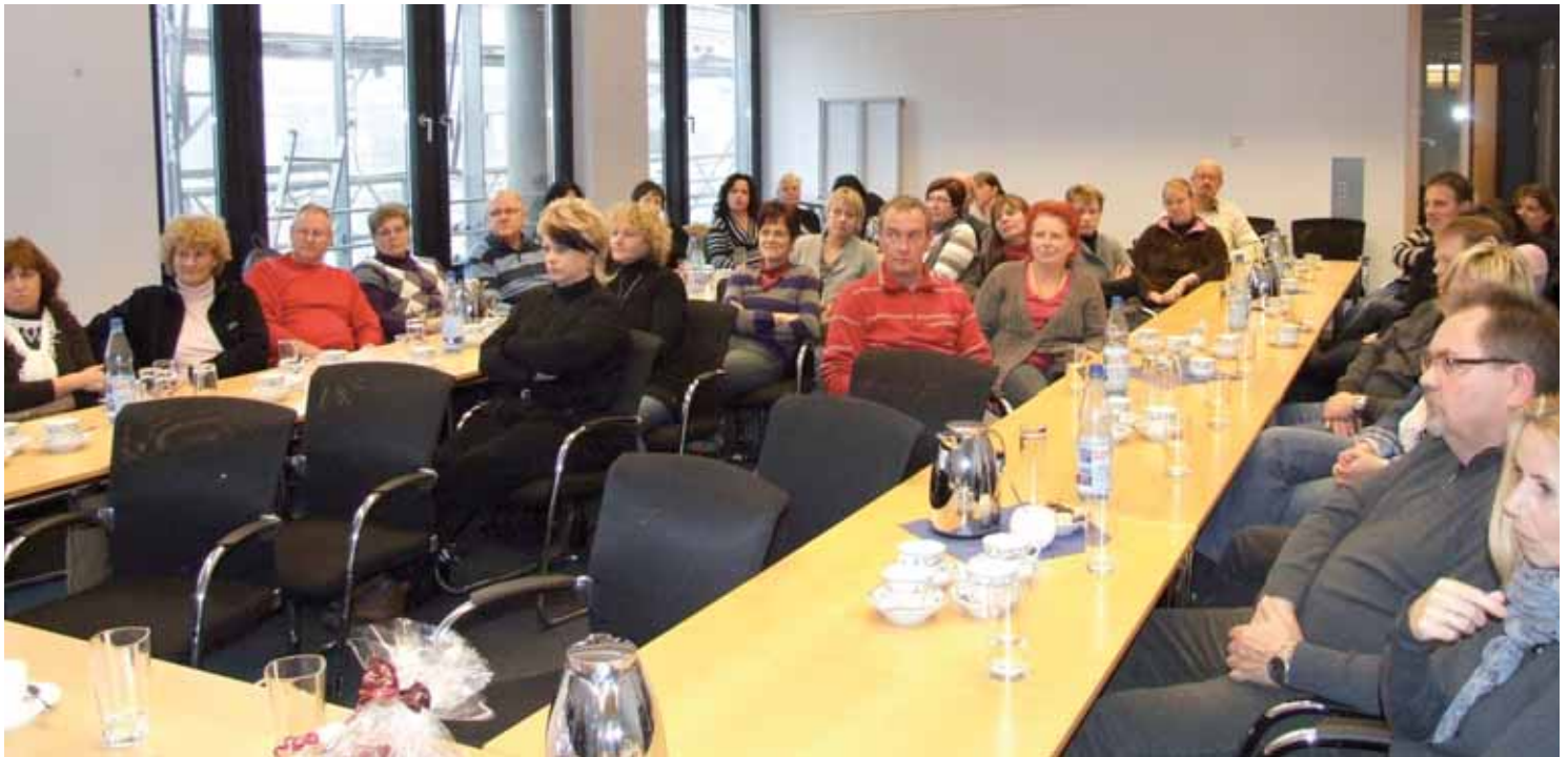
> Kolleginnen und Kollegen des Ortsverbandes Quedlinburg bei ihrem Besuch der Bundesgeschäftsstelle in Berlin.