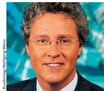
Klaus-Peter Flosbach, CDU/CSU, Wahlkreis Oberbergischer Kreis