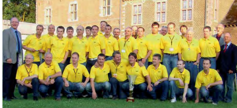
> Die deutsche Delegation vor der Abschlussfeier des 54. Internationalen Finanzsportturniers in Hasselt.

Die Belgier hatten bei der Eröffnungsfeier, beim obligatorischen Ausflug, während der Turnierwoche und insbesondere bei der Abschlussveranstaltung