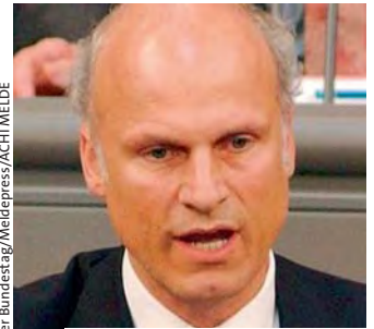
Carl-Ludwig Thiele, FDP, Wahlkreis Stadt Osnabrück