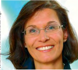
Antje Tillmann, CDU/CSU, Wahlkreis Erfurt-Weimar- Weimaer Land II