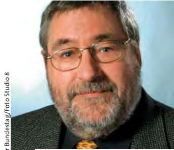
Dr. Axel Troost, DIE LINKE, Wahlkreis Bremen I