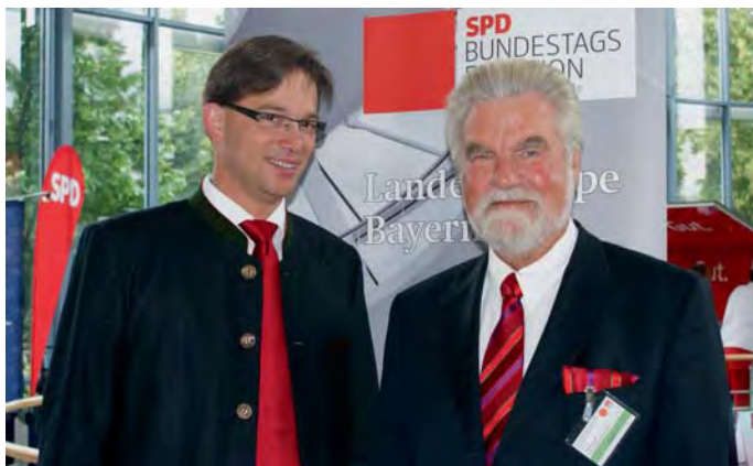
> Florian Pronold (li.) und Dieter Ondracek

Mit Florian Pronold pflegt der DSTG-Vorsitzende in Berlin eine enge und gute Zusammenarbeit. Nicht nur in den Sitzungen des Bundestags-Finanzausschusses, sondern auch außerhalb des Bundestages, traf der DSTG-Bundesvorsitzende öfter mit Florian Pronold zusammen, um steuerpolitische Vorhaben zu diskutieren. Dabei zeigte sich Pronold aufgeschlossen, die Meinung der DSTG zu hören und diese auch initiativ in den Bundestag einzubringen. Der DSTG-Bundesvorsitzende dankte Florian Pronold für die gute Zusammenarbeit in den vergangenen Jahren in Berlin und wünschte ihm für sein neues schweres Amt Glück und Erfolg. Ein Wahlergebnis von 12,8 % könne nur besser werden. ■