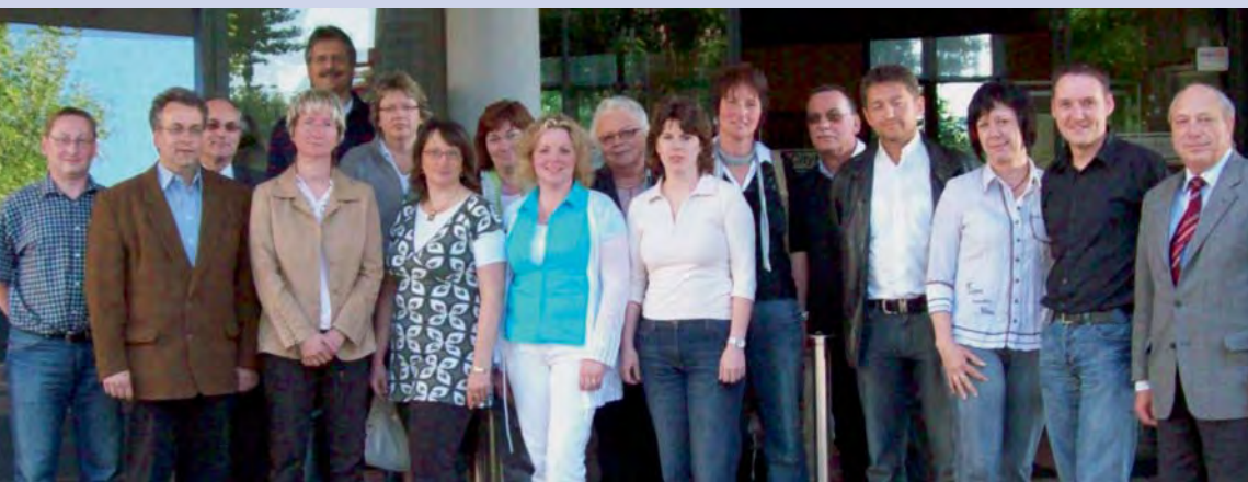
Die Seminar teilnehmerinnen und -teilnehmer mit den Dozenten in Magdeburg.

Vom 13. bis 15. Mai 2009 trafen sich Kolleginnen und Kollegen des Landesverbandes Sachsen-Anhalt in Magdeburg, um in einem Seminar der dbb akademie zur Mitgliederwerbung und -betreuung neue Erkenntnisse und Anregungen für die Gewerkschaftsarbeit zu gewinnen. Der breit gefächerte Teilnehmerkreis von langjährigen