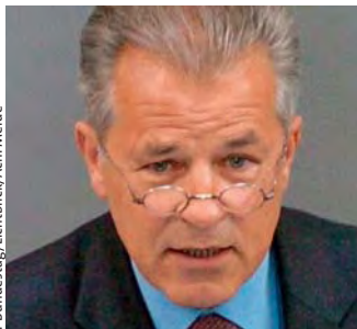
Peter Rzepka, CDU/CSU, Wahlkreis Berlin Tempelhof- Schöneberg