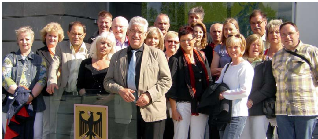
> Die Teilnehmerinnen und Teilnehmer des Tarifseminars vor dem Presse- und Informationsamt der Bundesregierung in Berlin.