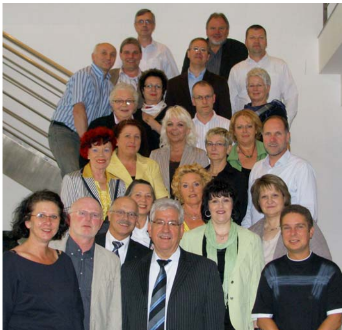
> Zu ihrer 78. Sitzung traf sich am 7. und 8. Mai 2009 die DSTG-Tarifkommission in Berlin.

Weitere Schwerpunkte der umfangreichen Tagesordnung waren die Tarifabschlüsse in den Ländern Berlin und Hessen – die nicht der Tarifgemeinschaft deutscher Länder angehören –, der Tarifvertrag für die Beschäftigten des öffentlichen Dienstes der Länder (TV-L) sowie der Tarifvertrag zur Überleitung der Beschäftigten der Länder in den TV-L und zur Regelung des Übergangsrechts (TVÜ-L), die noch zu verhandelnde Entgeltordnung, neuere Entwicklungen in der Zusatzversorgung des öffentlichen Dienstes im