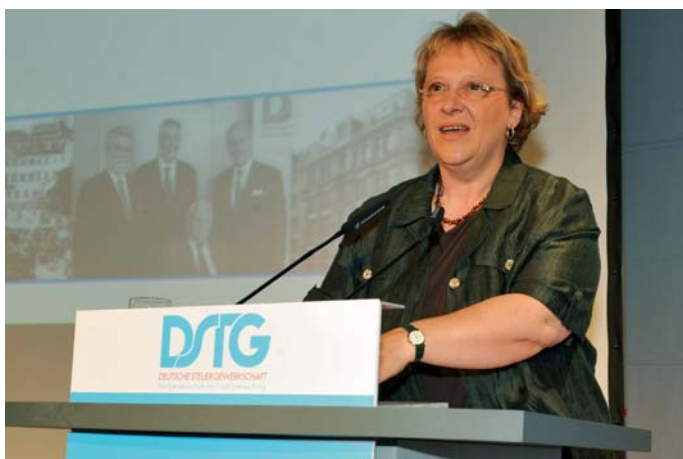
> Die parlamentarische Staatssekretärin beim Bundesminister der Finanzen, Nicolette Kressl, überbrachte im Namen von Bundesfinanzminister Peer Steinbrück die Glückwünsche zum 60-jährigen Jubiläum.

Der Erzbischof von Berlin, Georg Kardinal Sterzinsky beleuchtete aus ethischer Sicht die jüngst bekannten Fälle von Steuerhinterziehung sowie die im politischen Raum diskutierten Maßnahmen zur Austrocknung von Steueroasen und Bekämpfung von Steuerkriminalität und -betrug. Seine grundsätzlichen Ausführungen, aber auch sehr konkrete Mahnungen, fanden bei den Teilnehmern des Festaktes hohe Aufmerksamkeit und Zustimmung. Der Kardinal sagte, Steuerhinterziehung sei in einem demokratischen Gemeinwesen – anders als in der Geschichte vielfach argumentiert – als unmoralisch zu brandmarken. Kein Steuerpflichtiger dürfe sich mit der Begründung, der Staat würde die Steuermittel falsch einsetzen, aus seiner Steuerpflicht herausreden oder mit der Verlagerung seines Kapitals ins Ausland der hiesigen Steuerpflicht