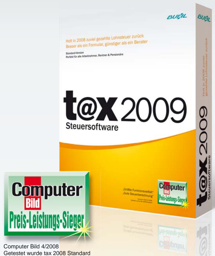
Computer Bild 4/2008 Getestet wurde tax 2008 Standard