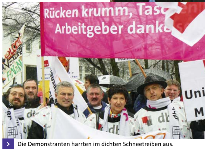
> Die Demonstranten harrten im dichten Schneetreiben aus.

für Banken und die Industrie von mehreren hundert Milliarden Euro aufgespannt. Die volle Erfüllung unserer Forderung von acht Prozent Entgeltsteigerung für Tarifbeschäftigte, Beamte und Versorgungsempfänger würde