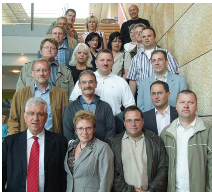
> Teilnehmerinnen und Teilnehmer des Tarifseminars Mitte Mai d. J. in Berlin.