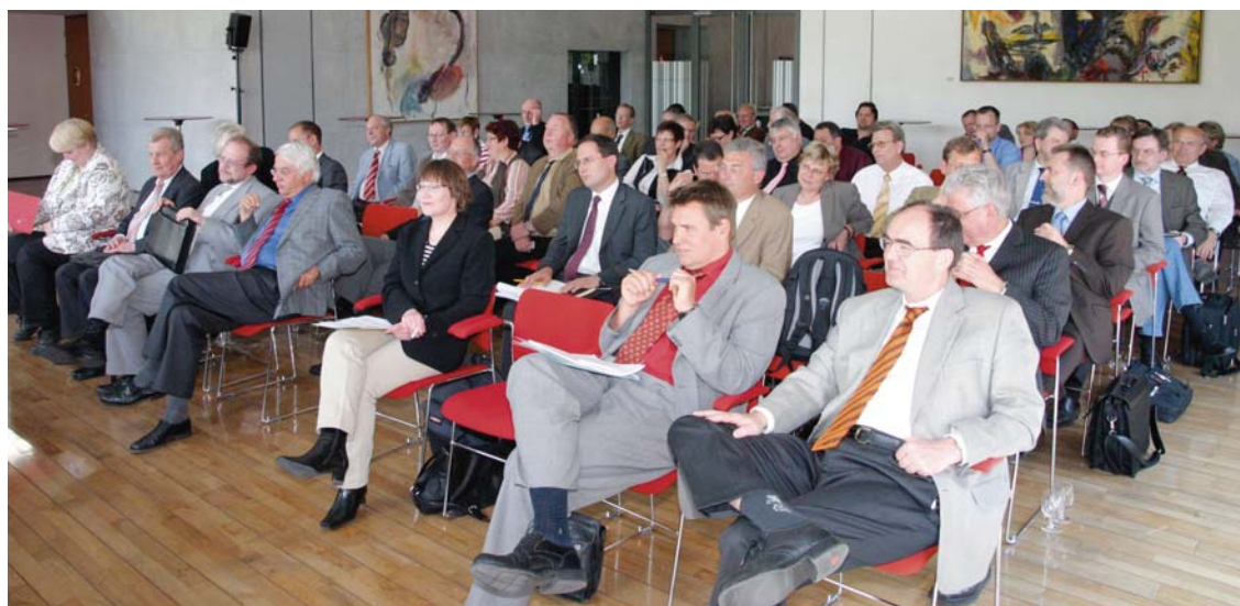
Ein interessiertes Fachpublikum verfolgte aufmerksam die Diskussionen über Ansätze zur Optimierung des Steuervollzuges in der Vertretung des Landes Bremen beim Bund in Berlin.

Die Staatssekretärin zeichnete die aus Sicht des Bundes notwendigen Ansätze für mehr Effizienz in der steuerlichen Verwaltung auf, die im Rahmen der Föderalismuskommission II verwirklicht werden müssten, darunter die klarstellende verfassungsrechtliche Regelung des allgemeinen fachlichen Weisungsrechtes des Bundes, eine Übertragung der Verwaltungskompetenz für die Versicherungsteuer auf den Bund sowie einzelner Bereiche der Steuerverwaltung, z. B. die Groß- und/oder Konzernbetriebsprüfung auf den Bund. Daneben müsse mit einer Priorisierung der Entwicklung von IT-Verfahren, dem Zugriff auf Länderdaten sowie einer effek-