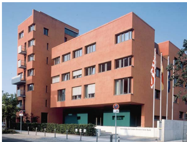
> Die Vertretung des Landes Bremen beim Bund war am 6. und 7. Mai 2008 ausgezeichnete Tagungsstätte für die Fachtagung zur Optimierung des Steuervollzugs.

Nicht sinnvoll sei es, einzelne Bereiche wie beispielsweise die Großbetriebsprüfung aus den Ländern herauszunehmen. Deubel zeigte sich zuversichtlich, die bestehenden Differenzen in der Föderalismuskommission II überwinden zu können, um zu konstruktiven Ergebnissen zu kommen.