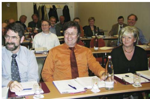
Die Vorsitzenden der Landes- und Bezirksverbände während der Tagung.