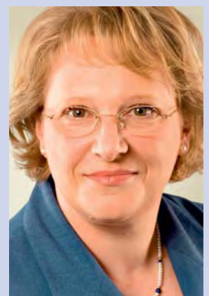
> Nicolette Kressl

Die SPD-Bundestagsabgeordnete Nicolette Kressl wurde mit Wirkung vom 17. November dieses Jahres zur Parlamentarischen Staatssekretärin beim Bundesminister der Finanzen ernannt. Sie tritt die Nachfolge von Dr. Barbara Hendricks an, die auf dem Parteitag der SPD in Hamburg Ende Oktober zur Schatzmeisterin der Partei gewählt wurde. Kressl ist seit 1994 Mitglied des Parlaments und war bis Ende der letzten Legislaturperiode Mitglied im Finanzausschuss des Deutschen Bundestages. Seit 2002 ist sie stellvertretende Vorsitzende der SPD-