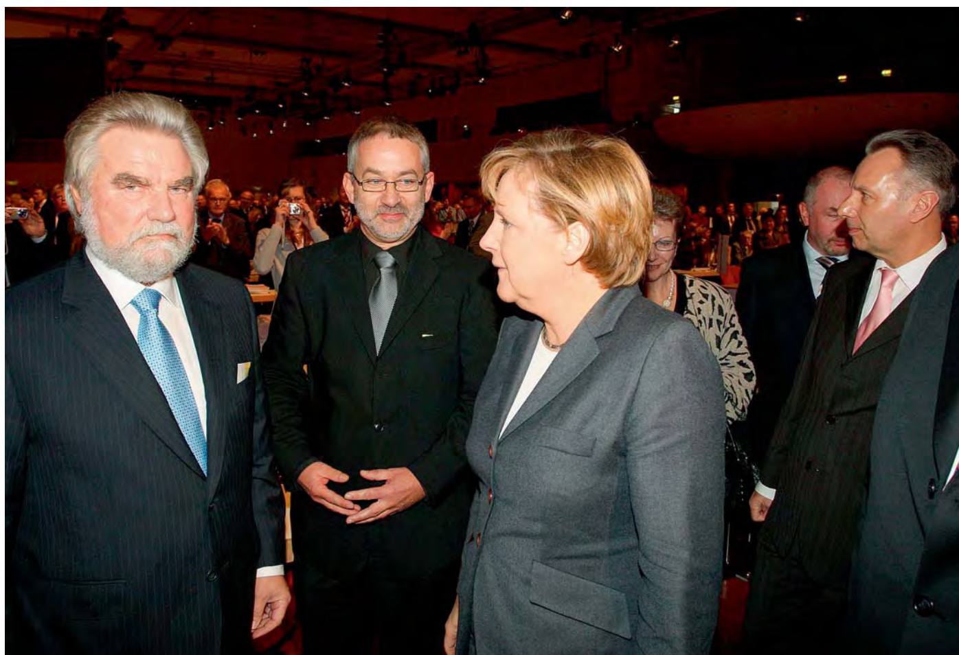
> Bundeskanzlerin Angela Merkel beim kurzen Dialog mit Dieter Ondracek im Rahmen des dbb Gewerkschaftstages 2007 in Berlin.