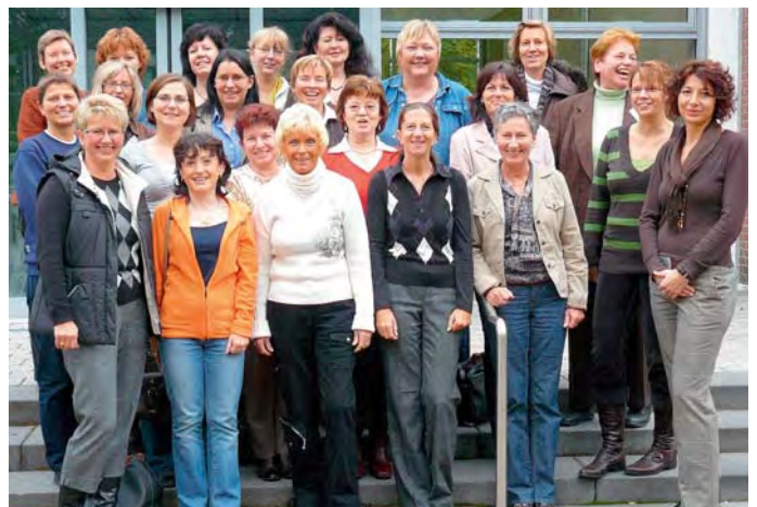
Die DSTG-Bundesfrauenvertretung kam am 26./27. Oktober 2007 zu ihrer Herbstsitzung in Bonn-Bad Godesberg zusammen, um u. a. die Grundmuster im Alltagsverhalten von Männern und Frauen zu beleuchten.

Die Delegiertenliste für den dbb Vertretertag zeigt, dass eine gleichwertige Beteiligung der Frauen nur durch eine Quo-