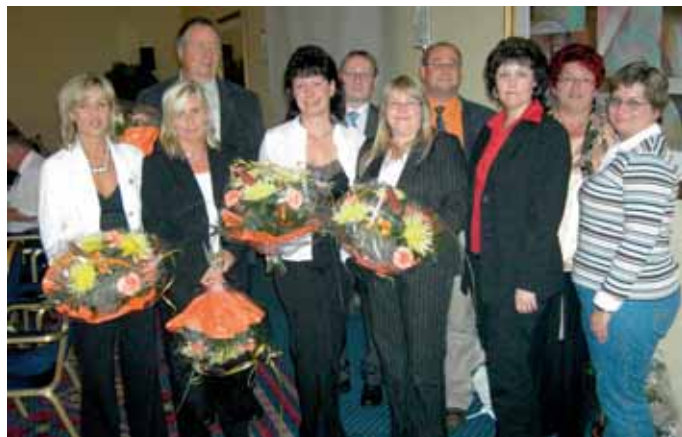
> Die neu gewählte Landesleitung des Landesverbandes Sachsen-Anhalt.

Zur öffentlichen Veranstaltung konnten viele prominente Gäste der DSTG, des dbb, aus der Finanzverwaltung und der Lan-