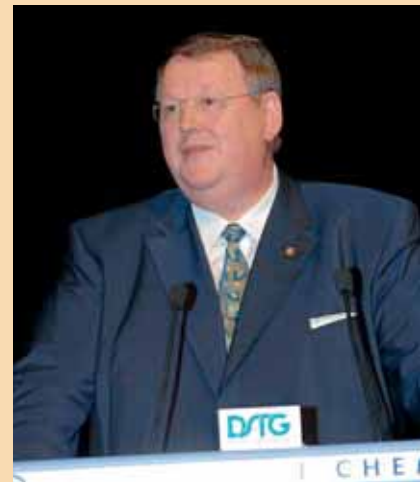
► Peter Heesen, Bundesvorsitzender dbb beamtenbund und tarifunion, machte sich für deutliche Einkommenssteigerungen stark.

warnt habe – es zeichne sich bereits jetzt ab, dass sich finanzschwache Länder auf dem Markt um die besten Köpfe nicht behaupten könnten. Interessant sei, dass sich die ersten Bundesländer zu regionalen Verbänden zusammenschließen wollten, um sich nicht gegenseitig Konkurrenz zu machen und mögliche Verwerfungen im Besoldungs- und Versorgungsrecht zu minimieren. Den Länderchefs hielt der dbb Vorsitzende vor, sie hätten diesen Wettbewerb gewollt, es dürfe nunmehr nicht beklagt werden, dass er teuer wird. ■