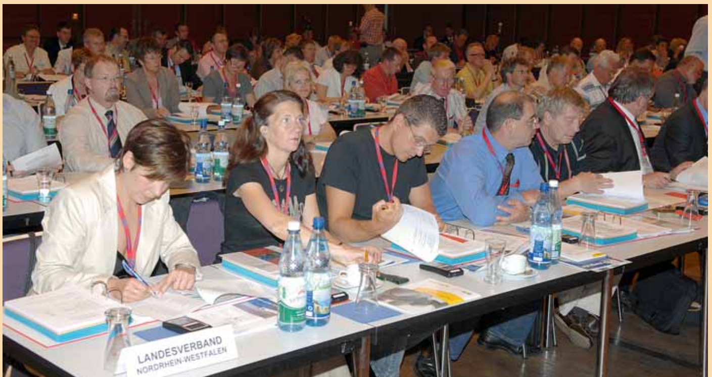
➤ Konzentrierte Antragsberatungen – Delegierte des DSTG-Landesverbandes Nordrhein-Westfalen und der Bayerischen Finanzgewerkschaft (o.).

hen, um das Steuerrecht nicht nur verständlicher, sondern auch vollziehbarer zu machen. Damit einher geht die Notwendigkeit in mehr Personal für die Steuerverwaltung zu investieren sowie die dienst-