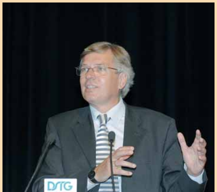
> Hartmut Möllring, Vorsitzender der TdL und Niedersächsischer Finanzminister hob den Zusammenhalt im Tarifbereich hervor.