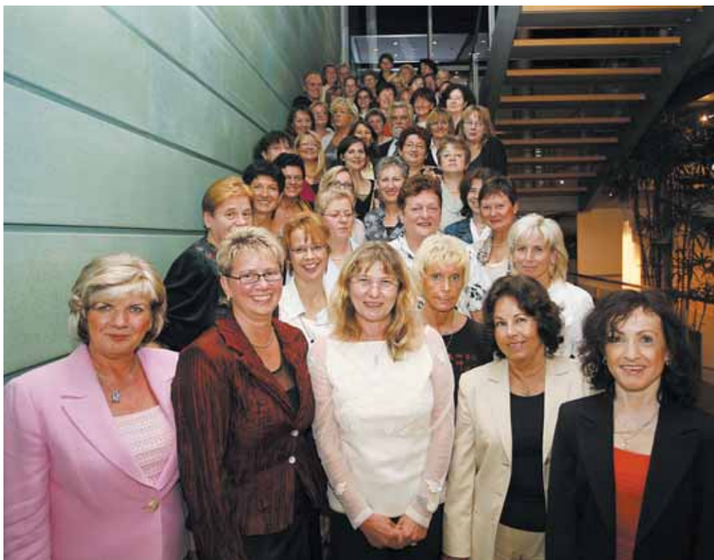
> Mit über 50 Teilnehmerinnen und Teilnehmern war die DSTG mit der größten Personengruppe auf dem Kongress vertreten. Die 75. Sitzung der Bundesfrauenvertretung findet auf Einladung des Landesverbandes Saar im März in Saarbrücken statt.

allgemeinen Regelungen zu den Stufen der Entgelttabelle im Mittelpunkt der Sitzung. Damit die Neuregelung zum Elterngeld ein Erfolgsmodell werden kann, ist die Verbesserung der Kinderbetreuungsmöglichkeiten eine zwingende Voraussetzung. Die Bundesfrauenvertretung fordert, dass ein Rechtsanspruch für Kinder unter drei Jahren eingeführt und perspektivisch auf alle Kinder bis zur Einschulung ausgeweitet wird. Für Kinder bis zum vollendeten zwölften Lebensjahr wird der Aufbau von Ganztagschulen angestrebt. Darüber hinaus soll gemeinsam mit den Bundesländern die Ausbildung von Erzieherinnen bis auf Fachhochschulniveau angehoben und die Umsetzung von Bildungs- und Erziehungsplänen durch flächendeckende Qualitätsinitiativen für Betreuungseinrichtungen verbessert werden. Die Bundesfrauenvertretung wurde vom Landesvorsitzenden des Landesverbandes Brandenburg, Holger Büchler,