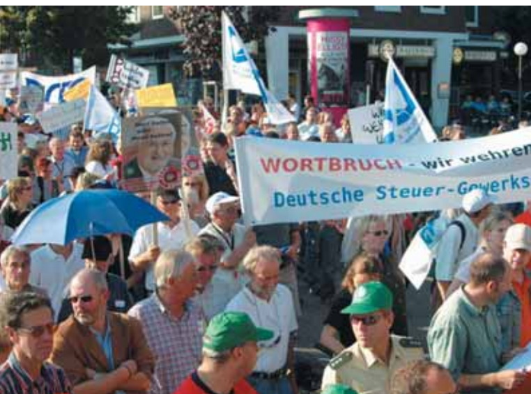
> Wortbruch warfen die Demonstranten in Kiel der Landesregierung vor.

Schleswig-Holstein machten zusammen mit den Angestellten und Beamten anderer Verwaltungsbereiche deutlich, dass sie die Nase voll haben von der allgemeinen und überall sichtbaren Tendenz, die Bedingungen für den öffentlichen Dienst ständig zu verschlechtern. Kein Landesvater Peter Harry Carstensen ließ sich blicken, der sonst so gern ein Bad in der Menge nimmt und um Popularität bemüht ist. „Wortbruch“ wurde der Landesregierung vorgeworfen, die sich