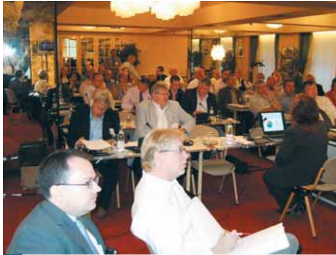
Die Mitglieder des UFE-Zollausschusses beim Vortrag zur Produktpiraterie und Zigaretenschmuggel.

22 EU-Staaten tauschen seit dem 1. Juli 2005 Auskünfte über die Zinserträge von EU-Bürgern aus. Österreich, Belgien und Luxemburg beteiligen sich nicht an dem Auskunftsverfahren. Sie behalten eine niedrige Quellensteuer ein. Der Anleger bleibt anonym. 75 % der durch diese Quellensteuer erzielten Einnahmen erhält der Staat, in