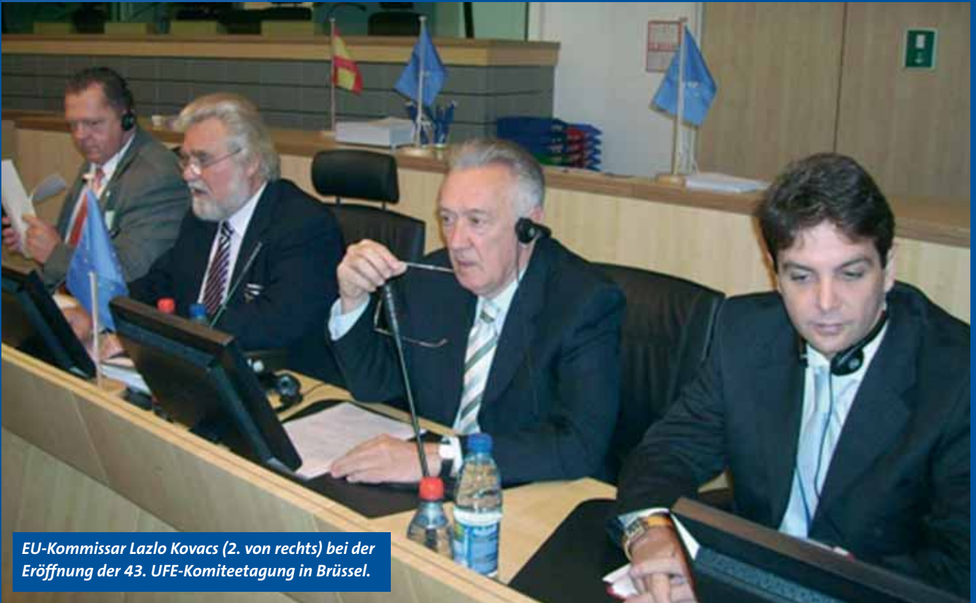
EU-Kommissar Lazlo Kovacs (2. von rechts) bei der Eröffnung der 43. UFE-Komiteetagung in Brüssel.

UFE auf Wachstumskurs Für EU-Kommission ein starker Faktor