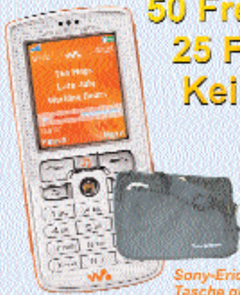
Sony-Ericsson-Tasche gratis dazu!

6 Monate kein Grundpreis* 50 Freiminuten im Monat* 25 Frei-SMS im Monat* Kein Anschlusspreis*