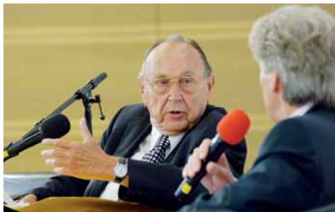
> Hans-Dietrich Genscher war Bundesinnenminister, als zu Beginn der 70er-Jahre die Besoldungskompetenz von den Ländern auf den Bund übergang. Als Zeitzeuge erläuterte er die damaligen Beweggründe und warnte nachdrücklich vor den Folgen einer erneuten Zersplitterung.

Sie führe zu „mehr Kleinstaatelei, Länderegoismus und Bürokratie“. Kleinere, finanzschwächere Länder würden benachteiligt. Auch sei es falsch, den Bund aus dem einheitlichen Beamtenrecht herauszudrängen,