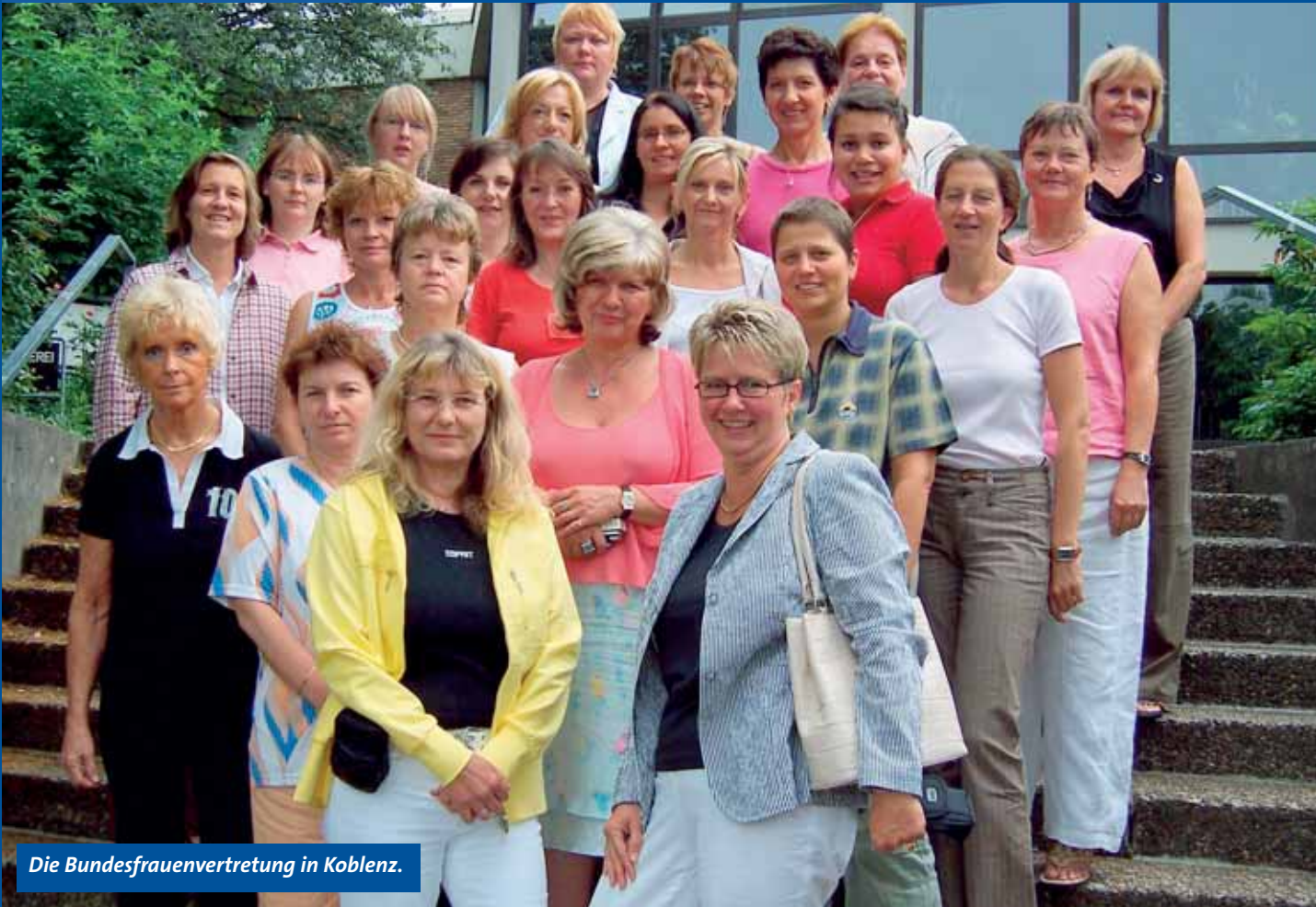
Die Bundesfrauenvertretung in Koblenz.

Bundesfrauenvertretung tagt in Koblenz Flexible Arbeitszeiten retten Fachwissen beurlaubter Frauen