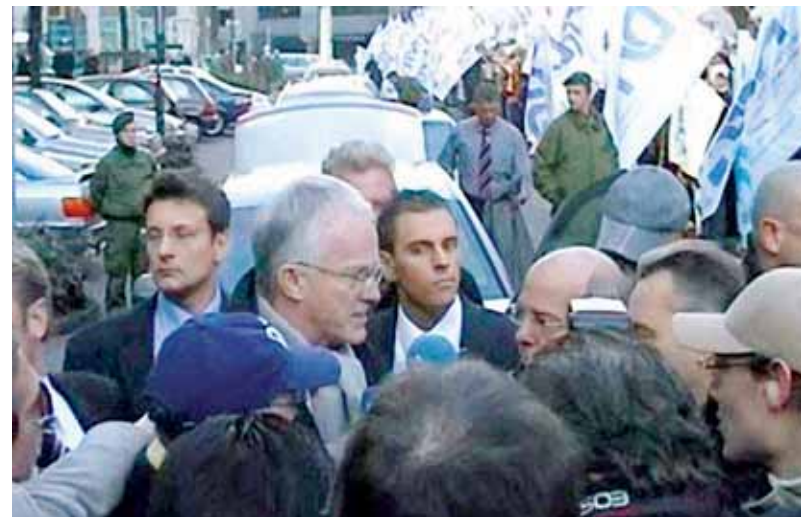
> Ministerpräsident Rüttgers im Gespräch mit Teilnehmern an der Protestaktion

Mehrere hundert Gäste hatte die CDU NRW zu ihrem traditionellen Neujahrsempfang