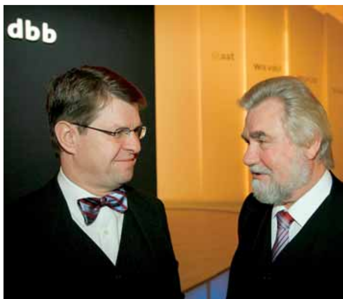
> Dieter Ondracek im Gespräch mit dem schleswig-holsteinischen Innenminister Dr. Ralf Stegner (vormals Finanzminister in Schleswig-Holstein).

Die gewerkschaftspolitische Arbeitstagung des dbb (s. Bericht im dbb Teil, Seiten 22, 23 und 40 ff.) bietet ausgesprochen gute Möglichkeiten, mit Politikern unterschiedlicher Couleur einen informellen Meinungsaustausch zu pflegen.