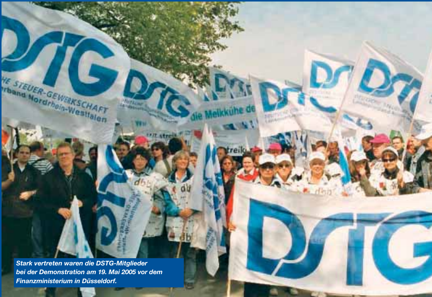
Stark vertreten waren die DSTG-Mitglieder bei der Demonstration am 19. Mai 2005 vor dem Finanzministerium in Düsseldorf.

Proteste und Streiks gegen Betonpolitik der Länder