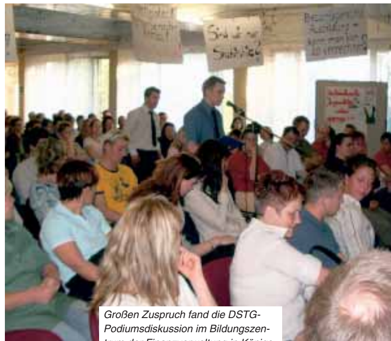
Großen Zuspruch fand die DSTG-Podiumsdiskussion im Bildungszentrum der Finanzverwaltung in Königs Wusterhausen.