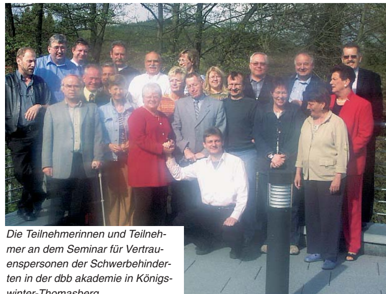
Die Teilnehmerinnen und Teilnehmer an dem Seminar für Vertrauenspersonen der Schwerbehinderten in der dbb akademie in Königswinter-Thomasberg.

mutbarkeit der Arbeitsmenge drücke sich in einem hohen und ständig steigenden Krankenstand aus. Daher bleibt es eine der wichtigsten Aufgaben der Gewerkschaft, für die erforderliche Personalausstattung zu sorgen.