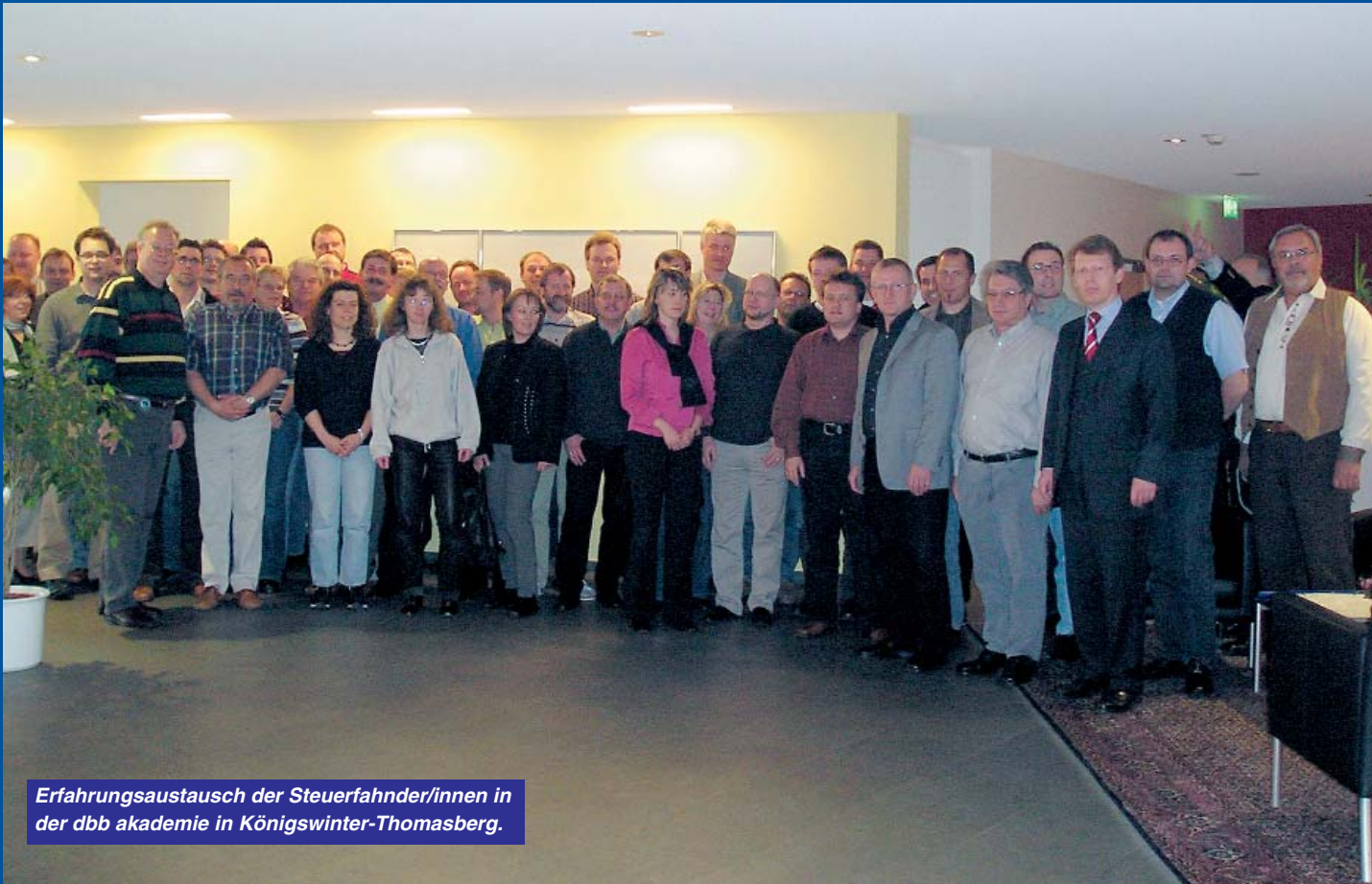
Erfahrungsaustausch der Steuerfahnder/innen in der dbb akademie in Königswinter-Thomasberg.

Steuerfahnder suchen Kontakt zur Politik