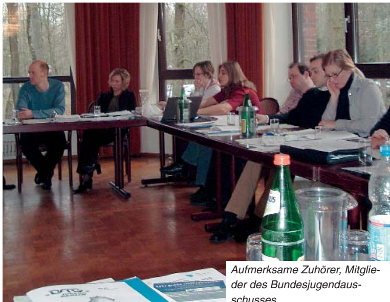
Aufmerksame Zuhörer, Mitglieder des Bundesjugendausschusses

cher Kongress bietet, um potenzielle Funktionsträger für die gewerkschaftliche Jugendarbeit zu finden, die die Zukunft unserer Verwaltung aktiv mitgestalten.