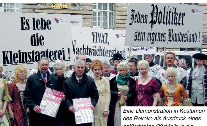
Eine Demonstration in Kostümen des Rokoko als Ausdruck eines befürchteten Rückfalls in die Kleinstaaterei organisierte die dbb tarifunion vor der Bayerischen Landesvertretung in Berlin

sen werden DSTG und dbb tarifunion nicht zulassen. Für Gewerkschaftsmitglieder gilt auch nach dem Austritt Hessens aus der TdL ein umfangreicher Schutz. Nach dem Ende der Mitgliedschaft Hessens in der TdL gelten alle Tarifverträge, die bis zum Austritt gegolten