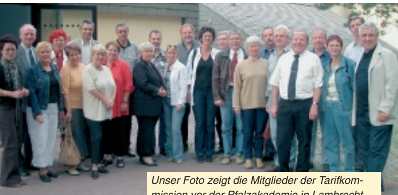
Unser Foto zeigt die Mitglieder der Tarifrundungskommission vor der Pfalzakademie in Lambrecht.

Arbeit in den einzelnen Arbeitsgruppen und der Lenkungsgruppe. Auf der umfangreichen Tagesordnung standen des Weiteren Fragen im Zusammenhang mit den Öffnungsklauseln im Besoldungsbereich, Tarif- und Eingruppierungsfragen, die Situation in den ostdeutschen Bundesländern, Arbeiter- und Organisationsangelegenheiten sowie die Vorbereitung auf den 9. Ordentlichen Gewerkschaftstag der dbb tarifunion im November 2003 in Leipzig.