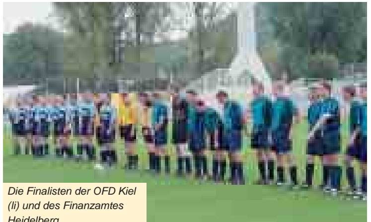
Die Finalisten der OFD Kiel (li) und des Finanzamtes Heidelberg.

Das Schachturnier war an Spannung kaum zu überbieten. Nach der letzten Runde blickten