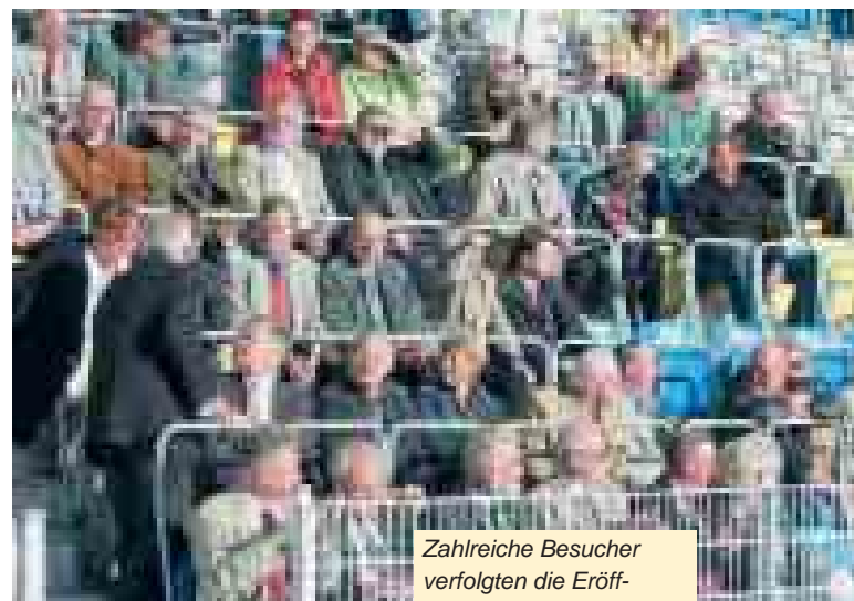
Zahlreiche Besucher verfolgten die Eröffnungsfeier im Stadion des FC Carl Zeiss Jena.

an der Spitze des Zwischenstands auf. Entscheidungen fallen am ersten Tag im Tischtennis bei den Mannschaftswettbewerben, wo die Herren der OFD Frankfurt ihren Titel verteidigen konnten, während den Damen des FA