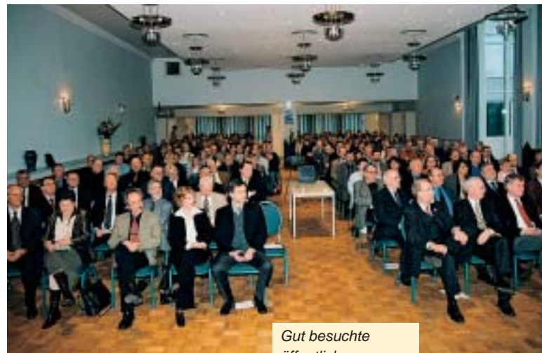
Gut besuchte öffentliche Veranstaltung