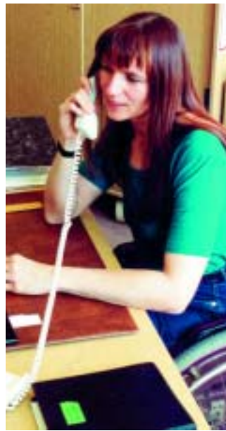
Dienststelle, die betroffenen Beschäftigten bei Gesundheitsproblemen Hinweise zur Problemlösung geben können.

Ein weiterer Schwerpunkt bildete das Gesundheitsmanagement, das der Gesundheitsgefährdung durch die Arbeitsplätze vorbeugen soll. Interessiert hörten die Seminarteilnehmer den Ausführungen über die Einrichtung des „Sozialen Ansprechpartners“ in Nordrhein-Westfalen zu. Es handelt sich dabei um geschulte Beschäftigte der jeweiligen