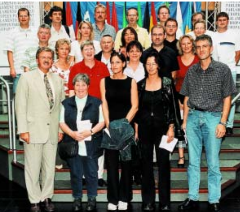
Die Mitglieder des Ortsverbandes im Finanzamt Frankfurt III am Tag nach dem „Freiburger Gespräch“ im Anschluss an eine Diskussion mit dem Europaabgeordneten Thomas Mann (li.) im Europaparlament in Straßburg.

Am 4. September 2002 trafen sich im Rahmen einer Bildungsmaßnahme 25 Kolleginnen und Kollegen des Ortsverbandes FA Frankfurt III mit fast ebenso vielen Kolleginnen und Kollegen des FA Freiburg – Stadt in Freiburg zu einem Gedanken- und Erfahrungsaustausch.