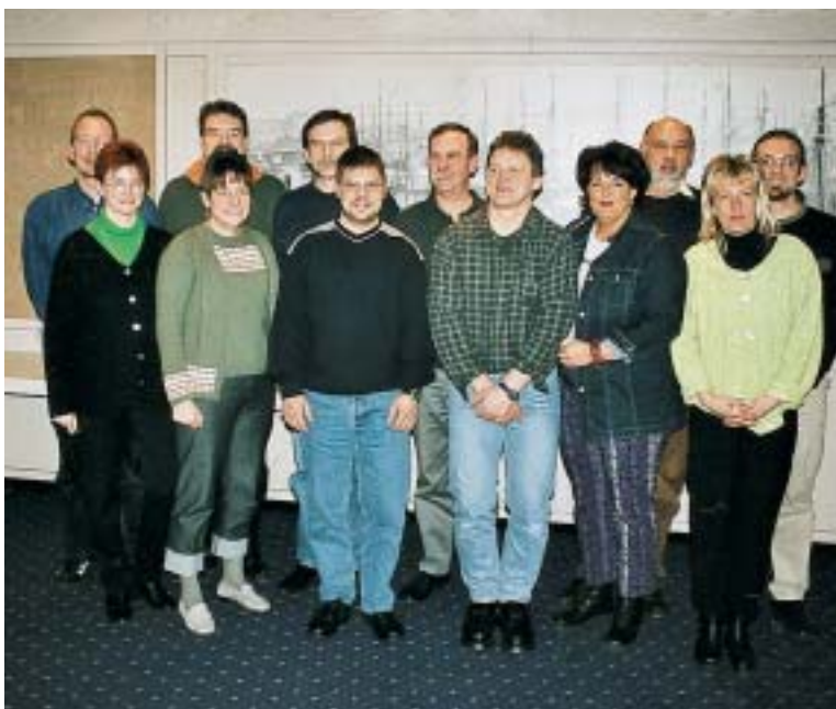
Haben eine gewaltige organisatorische Aufgabe zu bewältigen: die Kolleginnen und Kollegen der FSG OFD Hamburg e.V.

Fußballturnier vorgenommen (s. Kasten). Das Spiel um Platz 3 sowie das Fußballspiel sind für den 15. September 2001 ab ca. 14.00 Uhr vorgesehen. Für beste Unterhaltung bei den beiden Abendveranstaltungen hat das Orga-Team der FSG OFD Hamburg ebenfalls gesorgt.