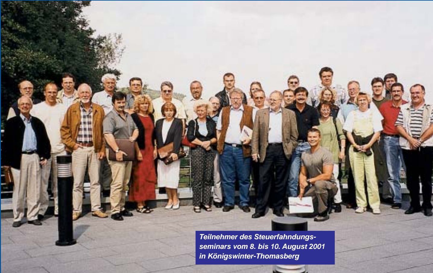
Teilnehmer des Steuerfahndungs- seminars vom 8. bis 10. August 2001 in Königswinter-Thomasberg

Starke Taskforce gegen Umsatzsteuerbetrug